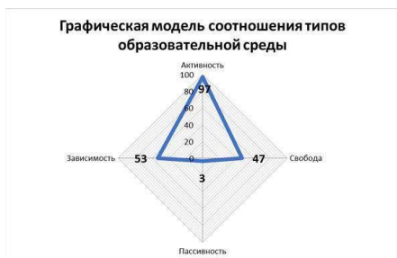
Рис. 1. Модель текущего состояния среды организации