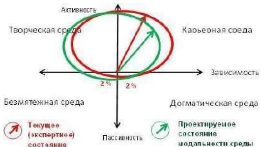
Рис. 2. Модель проектируемого состояния среды организации

Можно сказать, что проектируемое состояние стремится к «творческой» среде, формирующей более свободного и активного ребенка. Важной задачей является изменение модальности в сторону творческой среды.