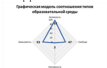
Рис.1. Модель текущего состояния среды организации

Таким образом, можно сделать вывод, что особенностью образовательной среды школы является выраженная «карьерная» среда. Важно обратить внимание на недостатки образовательной среды и создать условия, которые бы способствовали активности и свободе ребенка, то есть творческой атмосфере.